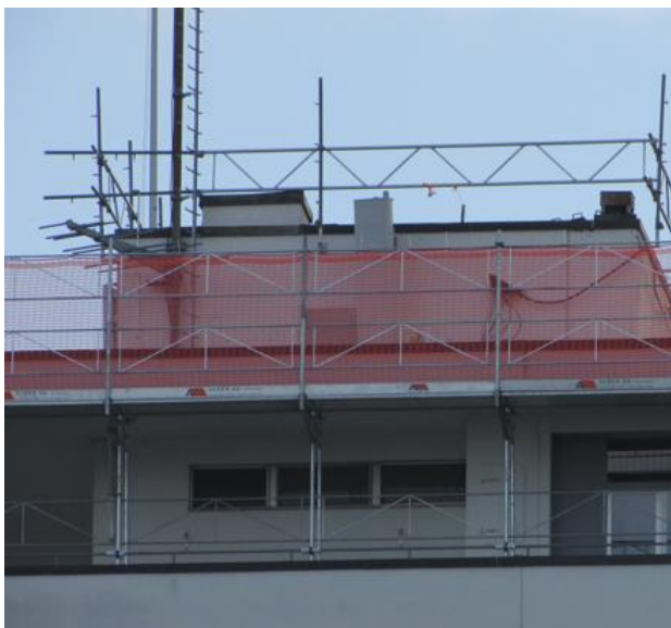
Nordseite, SR zur St.Gallerstrasse