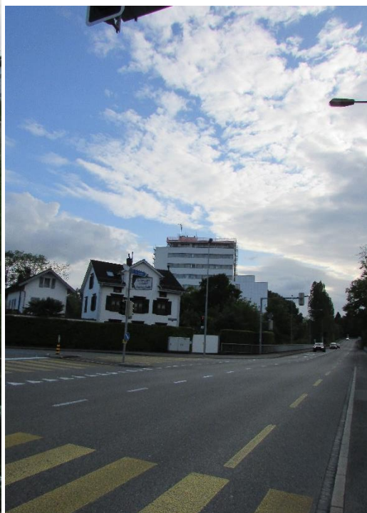
Zustand Senderstandort: seit mehreren Wochen im Gerüst: