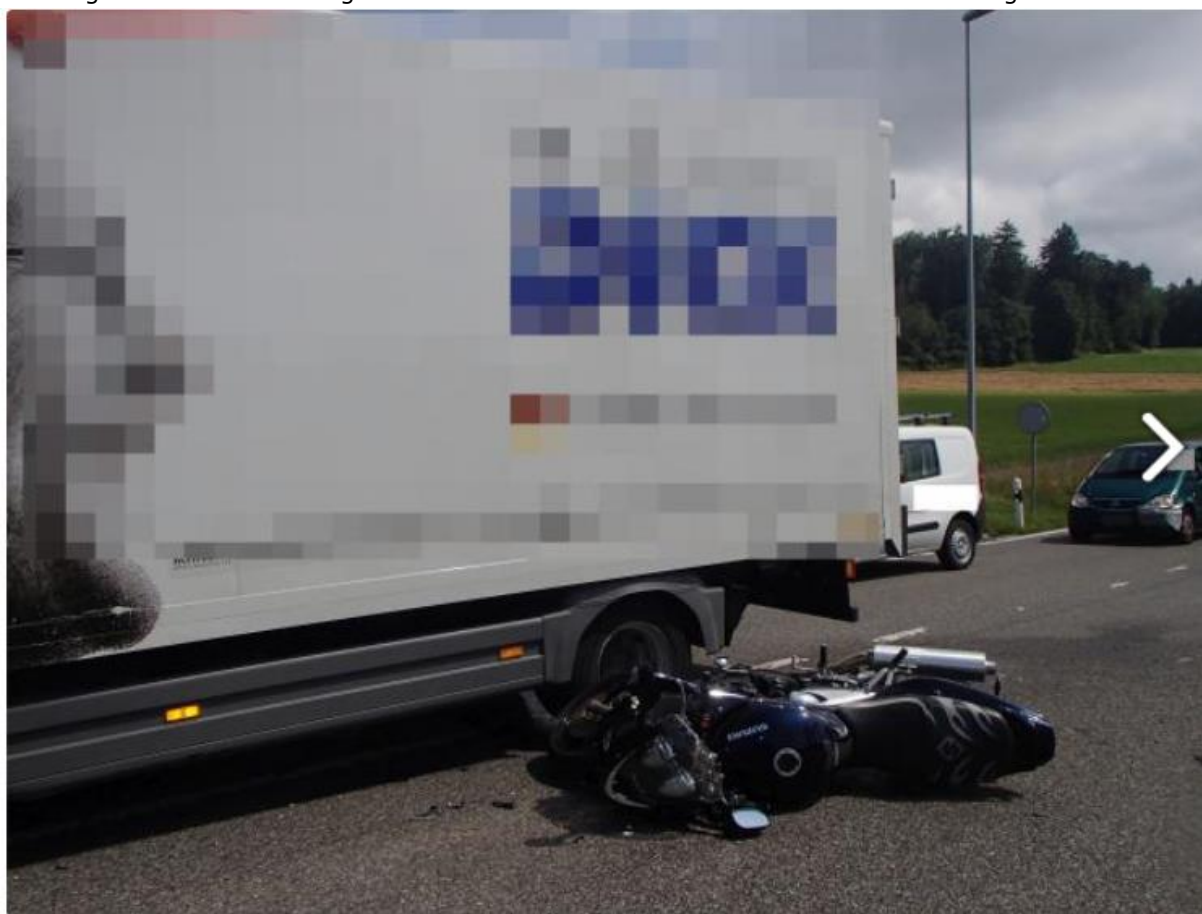
Oberwil-Lieli AG - Motorradfahrer von Lastwagen erfasst

Ein Motorradfahrer zog sich bei einer Kollision mit einem Lastwagen mittelschwere Verletzungen zu. Der deutsche Lastwagenchauffeur, der in die Bremgartenstrasse einmünden wollte, dürfte ihn übersehen haben. Ein 38-jähriger deutscher Lastwagenchauffeur fuhr gestern Freitag, 01. Juli 2016, 11.15 Uhr in Oberwil-Lieli linksabbiegend in die Bremgartenstrasse. Dabei übersah der vortrittsbelastete Lenker ein von links herannahendes Motorrad. Beim Zusammenstoss kam der 38-jährige Motorradfahrer zu Fall und zog sich mittelschwere Verletzungen zu. Kantons- und Regionalpolizei sowie Ambulanzfahrzeug rückten vor Ort aus. Der verletzte Schweizer wurde durch die Ambulanzbesatzung ins Spital eingeliefert. Der Sachschaden beträgt zirka 11'000 Franken. Der Lastwagenfahrer aus der Region Südbaden wurde an die Staatsanwaltschaft angezeigt.