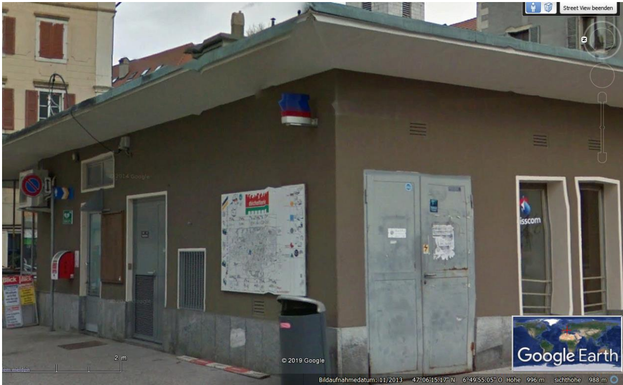
Swisscom Telefonkabinen, vermutlich auch ein lokaler Kleinsender.