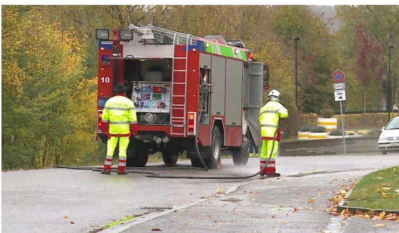
Reinigung der Strasse an rechter Fahrzeugseite. Unfallposition somit vermutlich rechts vorne, Front schwer einsehbar.