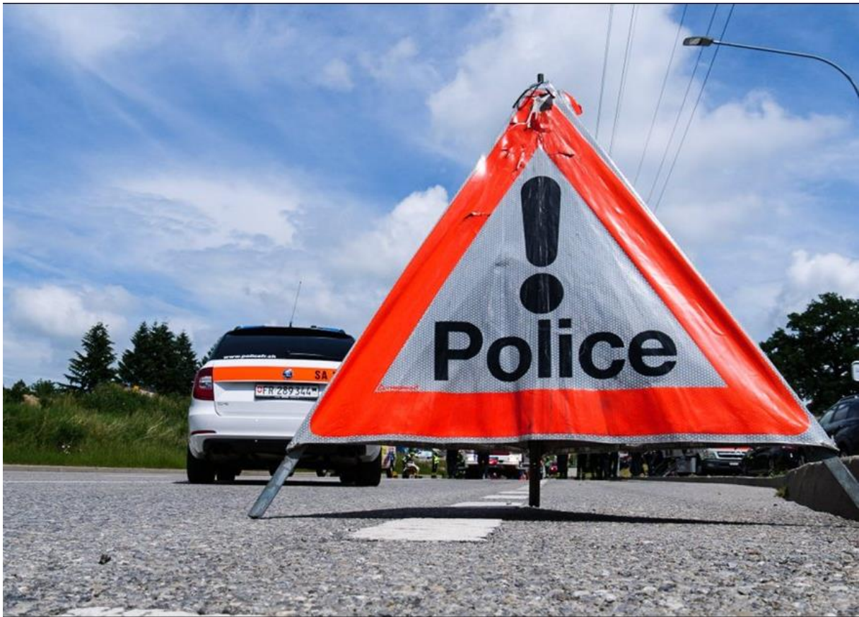
Foto ist vermutlich Symbol/ Archivbild ohne Bezug zur Unfallsituation.