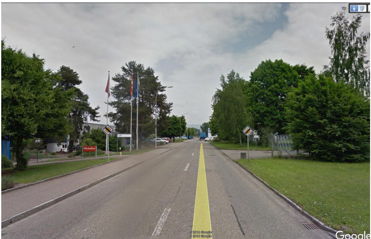
Ende hauptstrasse ca 100 m nach 90° linkskurve.