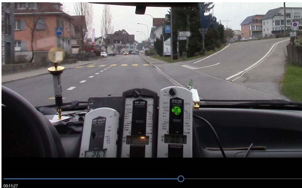
Geräte: links elektromagnetisches Feld in nT mitte HF Funkstrahlung (über 200uW/m2), rechts HF Radar usw.